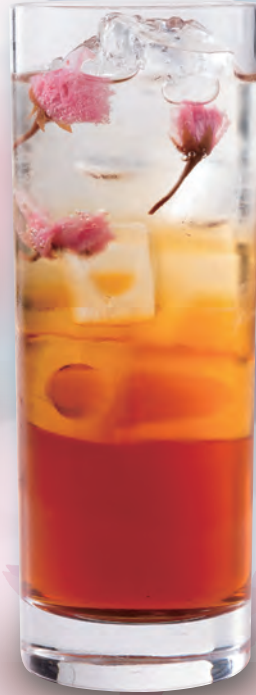
SAKURA Ice Tea