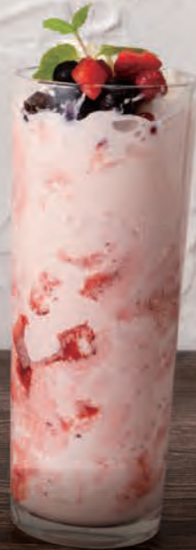
3 ベリーシェイク Berry Shake