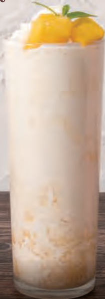
2 マンゴー バナナシェイク Mango Banana Shake