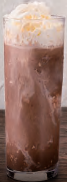
4 ココアシェイク Cocoa Shake