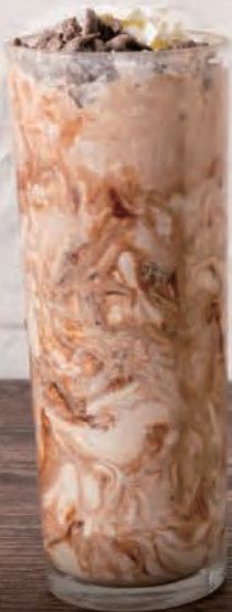
1 カフェモカ シェイク Cafe Mocha Shake