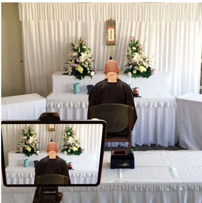
リモート法要（イメージ）

変わりゆく時代に合わせながらも、変わらない故人を偲ぶ時間をお持ちいただけるよう、弊社では、コロナ禍でも安心して実施いただけるよう、感染防止対策を徹底した「弔事」「法要」を提案いたします。