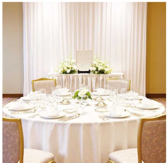
少人数での法要・会食（イメージ）