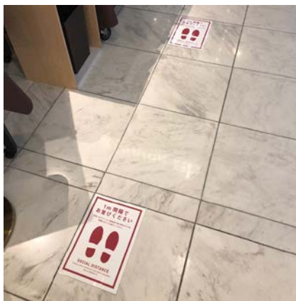
間隔確保イメージ