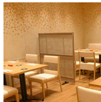
レストラン店内イメージ