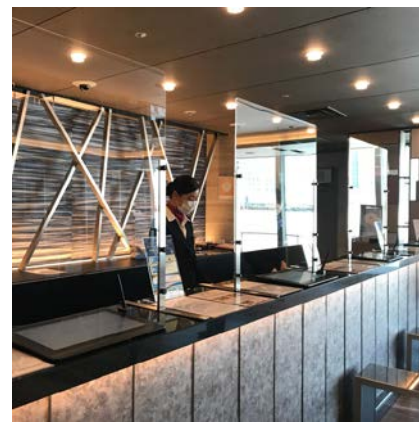
飛沫感染防止シールド(フロント)