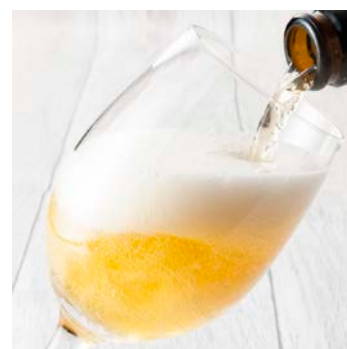
ドリンクサービスイメージ