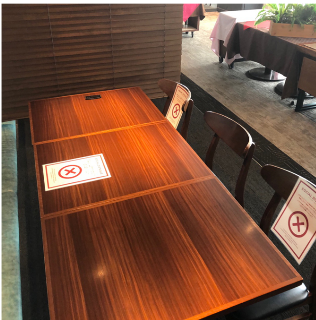
ソーシャルディスタンスの確保 イメージ

また、混雑緩和対策として事前予約をおすすめする「ご予約特典」を設けるなど、お客様同士の再会、お客様とホテルとの再会を、より安全に、安心して過ごしていただけるよう、努めてまいります。