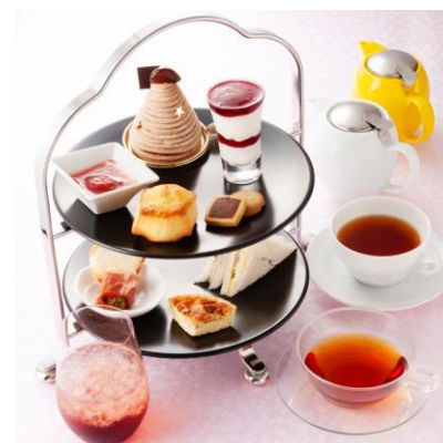
アフタヌーンティーセット