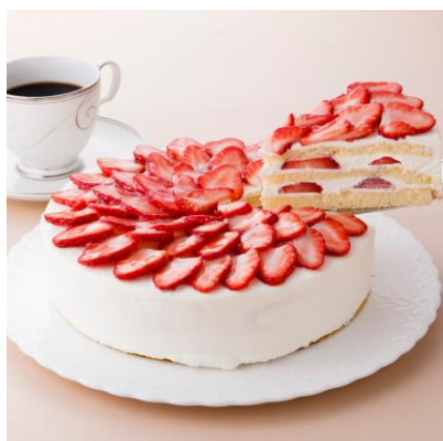
プレミアムショートケーキ