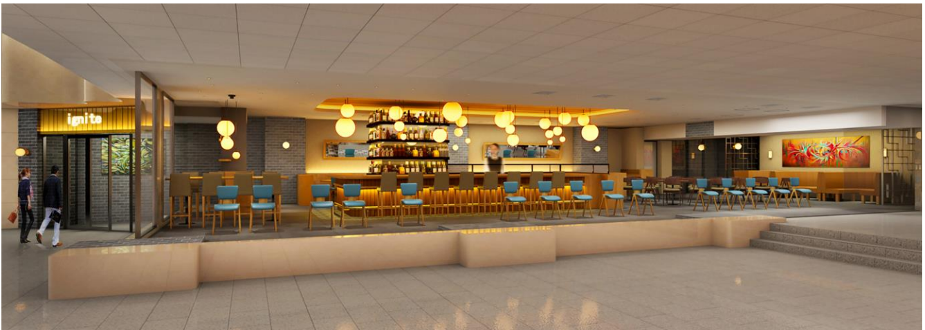
新店舗 カフェ&ダイニング「ignite(イグナイト)」イメージパース

株式会社ホテルグランヴィア大阪（大阪市北区梅田3-1-1：代表取締役社長 宮崎好弘）では、館内全面リニューアルの第2期として1階のリニューアルに着手し、2020年2月～4月にかけて、新たなレストランのオープンやティーラウンジへの個室の新設、またエントランスのリニューアルを行い、より快適なスペースを提供してまいります。