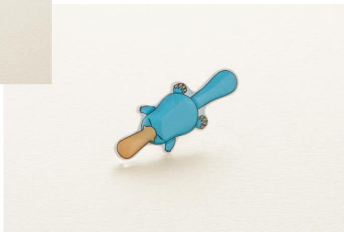
ホテルグランヴィア大阪オリジナル「カモノハシのイコちゃんピンバッチ」