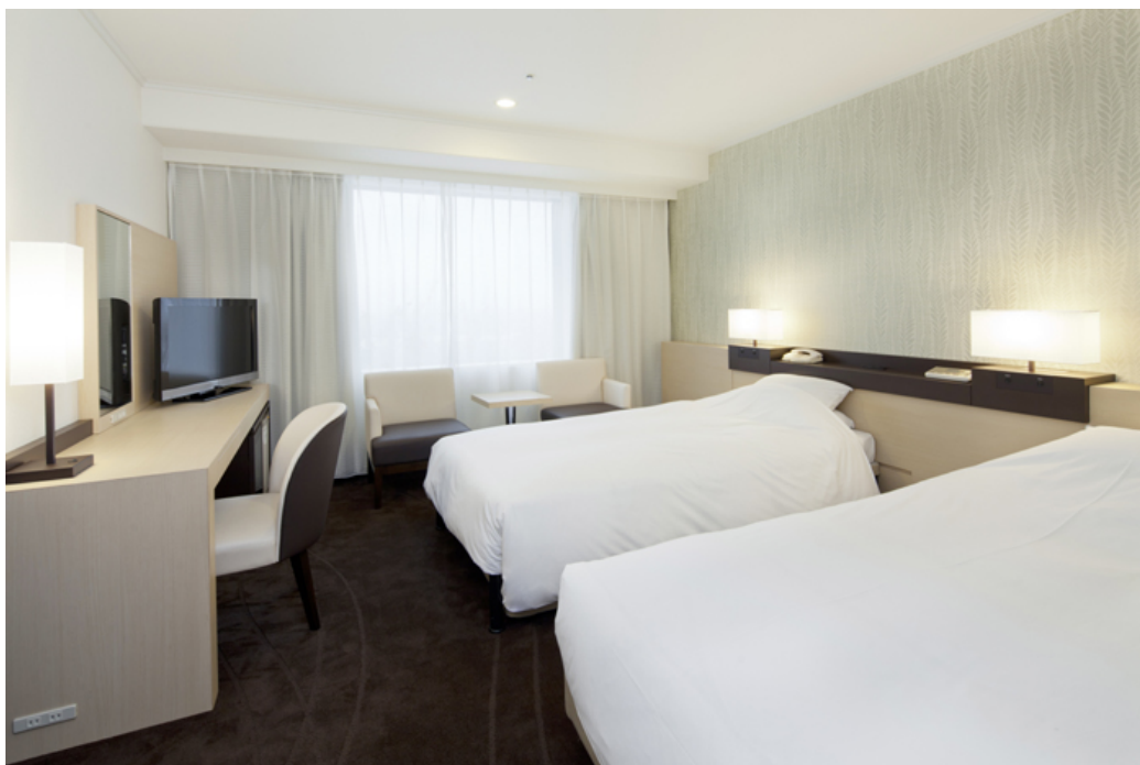
23階 ツインルーム 写真

ホテルグランヴィア大阪（大阪市北区梅田3-1-1、代表取締役社長：五十嵐晃）は、このたび23階客室の一部計56室（ツインルーム29室、スタンダードダブル14室、デラックスシングルルーム13室）の改装を実施し、平成23年7月26日（火）リニューアルオープンいたします。