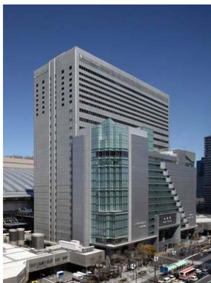
ホテルグランヴィア大阪 外観